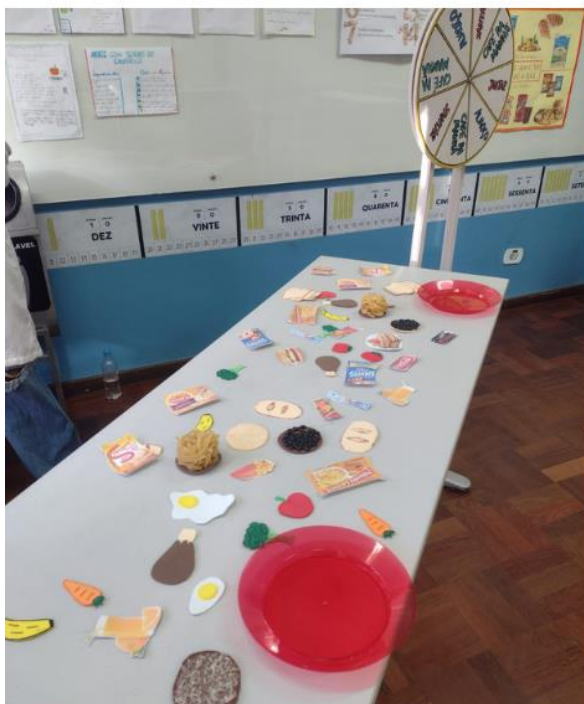
Figura 2: Cenário 1, dinâmica da roleta e construção das refeições.